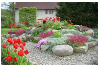
wydzielony kącik rekreacyjny