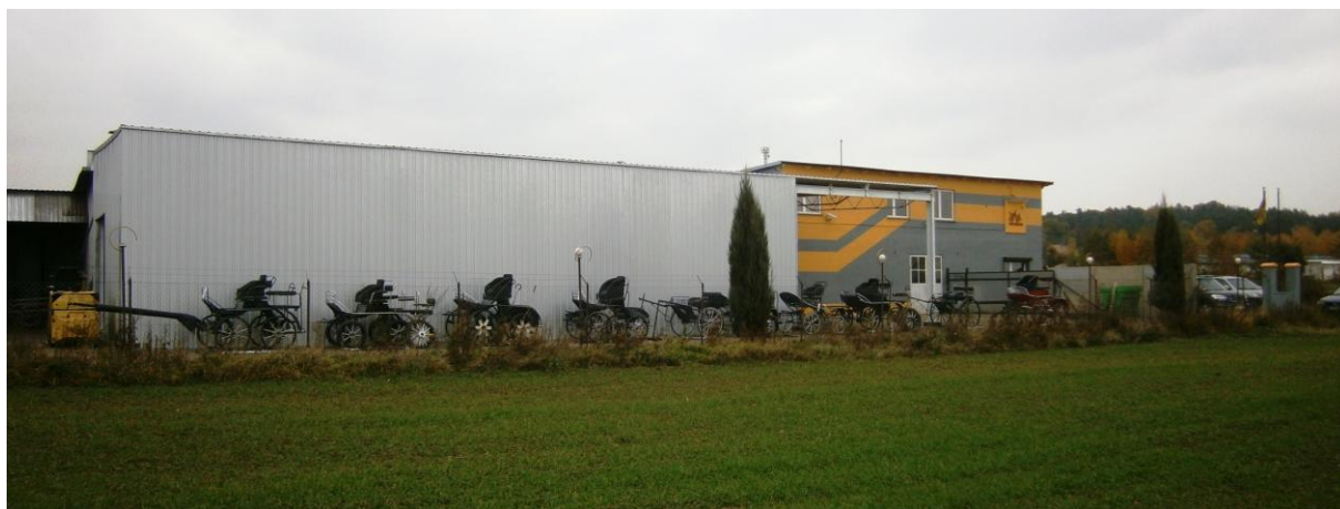
widok zakładu produkcyjnego w Goli Wąsowskiej

Wszystkim uczestnikom konkursu gratulujemy wysokiego poziomu i serdecznie zapraszamy do naszego Ośrodka na uroczyste podsumowanie XX wojewódzkiej edycji konkursu „AgroLiga 2012”, na którym wręczone zostaną laureatom nagrody i okolicznościowe dyplomy. Uroczystość planujemy zorganizować 20 listopada b.r. w DODR we Wrocławiu.