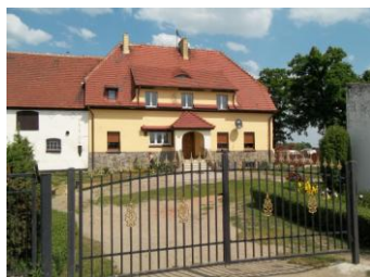
wjazd do gospodarstwa